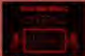
▲自分の好きな名前を入力しよう。 ★おぼろしい記憶のゲームオーバーは、 心細くともう一度プレイしてみよう。

Bボタンでゲームを終了させ、スコアがランキングのベスト10に入っていた場合は、名前入力画面になります。十字ボタンの上下左右で文字の選択、Aボタンで入力です。Bボタンを押すと、1つ前の文字に戻ります。「END」にカーソルを合わせてAボタンを押すと名前入力が終了し、ランキング画面の表示後、Aボタンを押すとタイトル画面に戻ります。