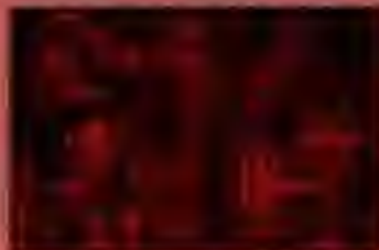
▲これは精神とはまさにごめんご。